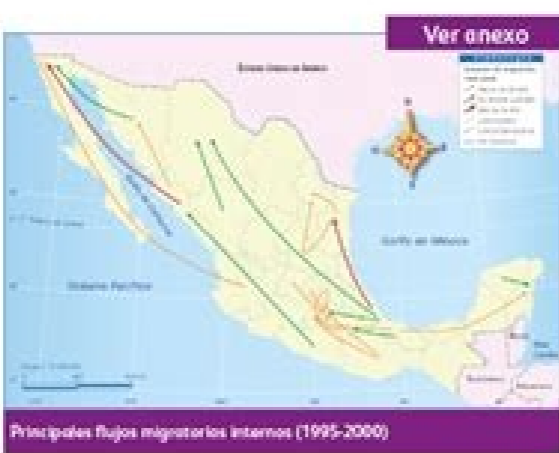
Principales flujos migratorios internos (1995-2000)