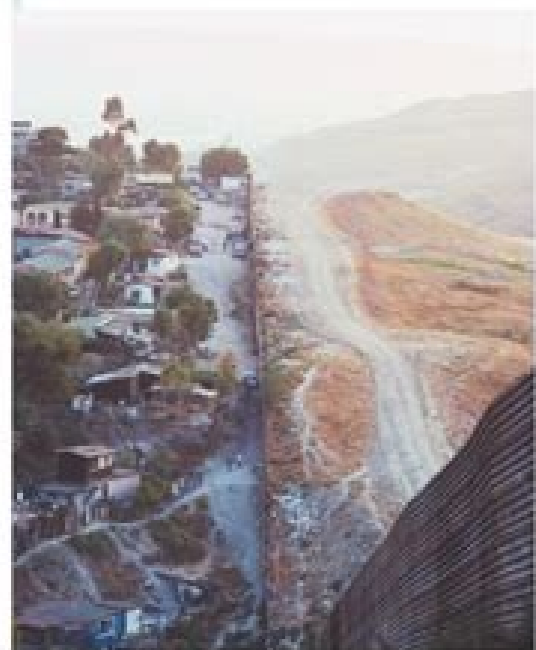
La frontera internacional con mayor intercambio comercial y humano es la que separa a México de Estados Unidos, por lo que diariamente cruzan miles de personas en ambos sentidos.

¿De dónde sale el mayor número de migrantes?, ¿hacia dónde se dirigen?, ¿cómo es el flujo migratorio en tu entidad?